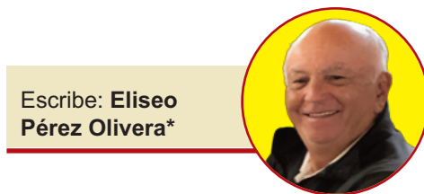
Escribe: Eliseo Pérez Olivera*

La ciudad dejó de organizarse exclusivamente alrededor de la Plaza 25 de Mayo y comenzó a fragmentarse en múltiples polos comerciales, residenciales y recreativos. El antiguo microcentro perdió parte de la exclusividad funcional que había mantenido durante décadas y debió adaptarse a una nueva lógica ur-